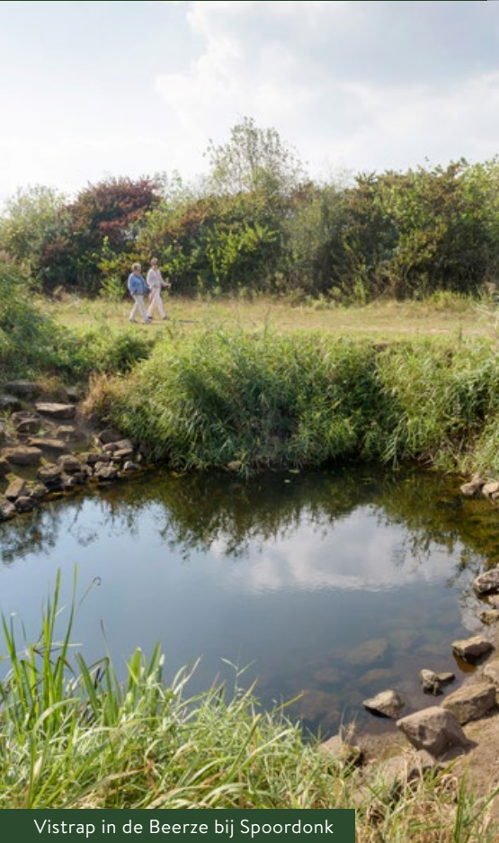
Vistrap in de Beerze bij Spoordonk