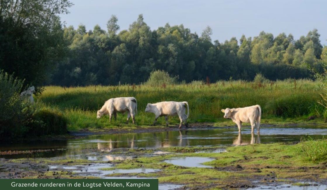
Grazende runderen in de Logtse Velden, Kampina