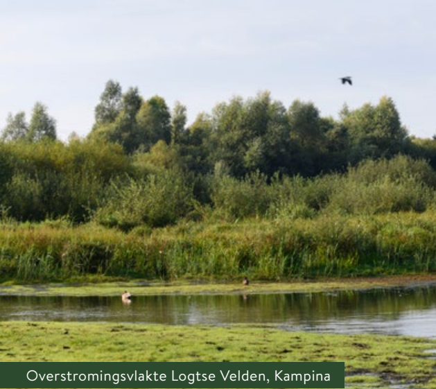
Overstromingsvlakte Logtse Velden, Kampina